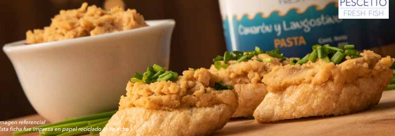
Imagen referencial Esta ficha fue impresa en papel reciclado shiro echo