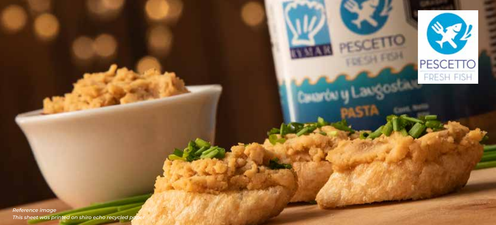
Reference image This sheet was printed on shiro echo recycled paper